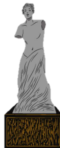
米羅 維納斯女神像